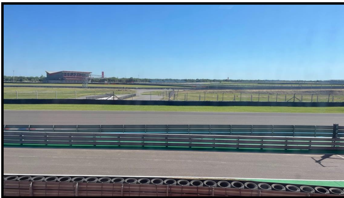
Figura 3: Autopista de clase mundial vacía en Río Hondo