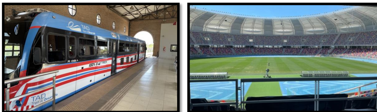
Figura 4: El tren diesel “eléctrico” (izquierda) y dentro del estadio de fútbol Única Madre de Ciudades (IBI Consultants)