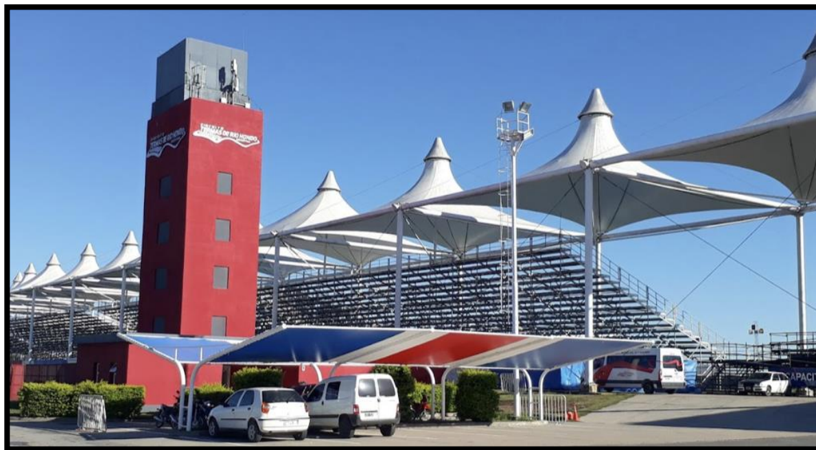
Figura 6: El autódromo de Río Hondo