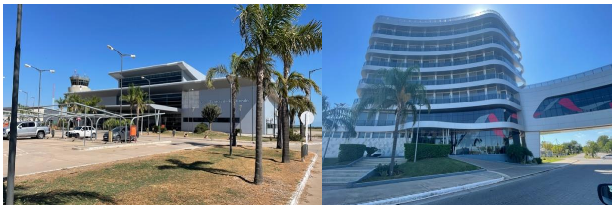
Figura 7: El Aeropuerto Internacional de Río Hondo vacío (izquierda) y un hotel de lujo vacío cerca de la autopista de Río Hondo (derecha) (IBI Consultants)

detallando el uso de aviones provinciales por parte de Zamora para volar pesos argentinos, constantemente devaluados debido a la inflación desenfrenada, a Buenos Aires, para comprar miles de dólares estadounidenses como cobertura contra la devaluación; también hay registros de dos vuelos a Nueva Orleans con escala en Panamá, y otros vuelos no médicos. 27